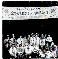
青少年の育成 ガールスカウト活動に参加