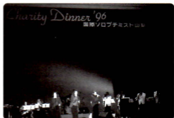
チャリティディナーショー (スリーグレイセス)