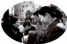
ハンドインハンド (ユニセフ街頭募金)