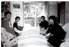
おむつたみ (国立西甲府病院)