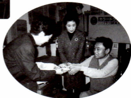
障害者自立の援助 (ステップandステップ)