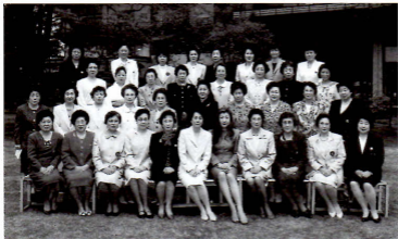
新会員認証式 (常磐ホテル)