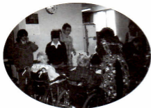
老人ホーム慰問 (相久園)