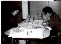
作業奉仕 (山梨ライトハウス)