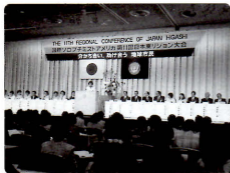
日本東リジョン大会 (ホテルニューオータニ)