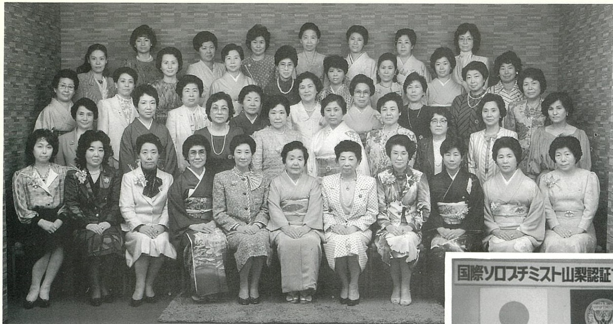
'86.4.21 国際ソロプチミスト山梨認証10周年記念 (古名屋ホテル)