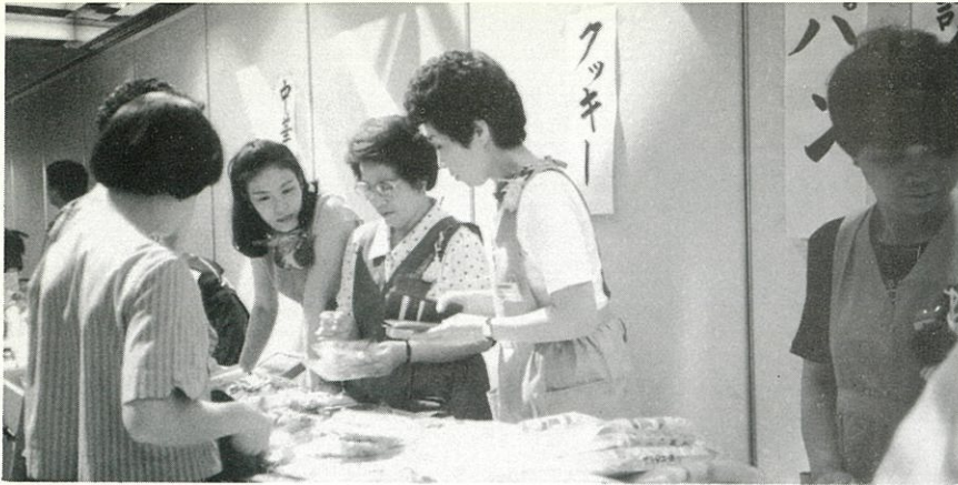
'86.9.26 第11回チャリティーバザー