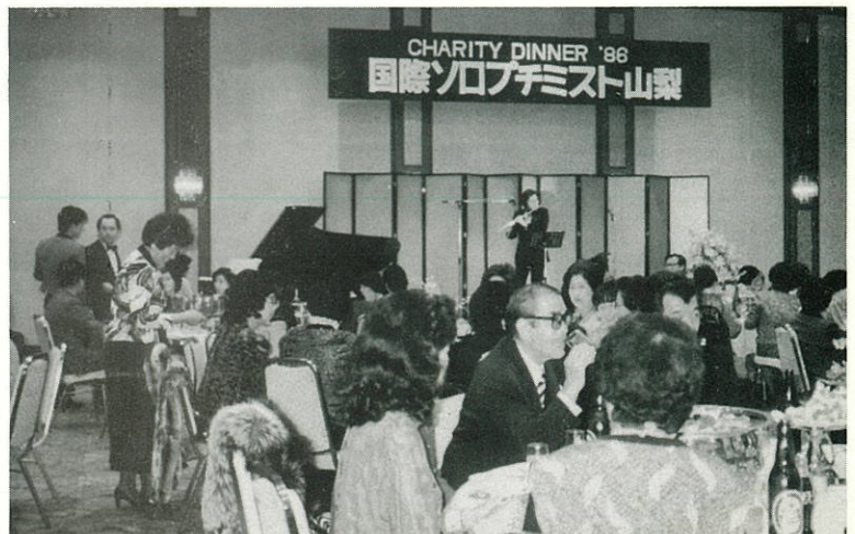
'86.12.5 '86 チャリティーディナーパーティー