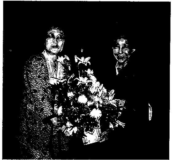
'86.7.4~7.9 アメリカ連盟大会(シアトル)