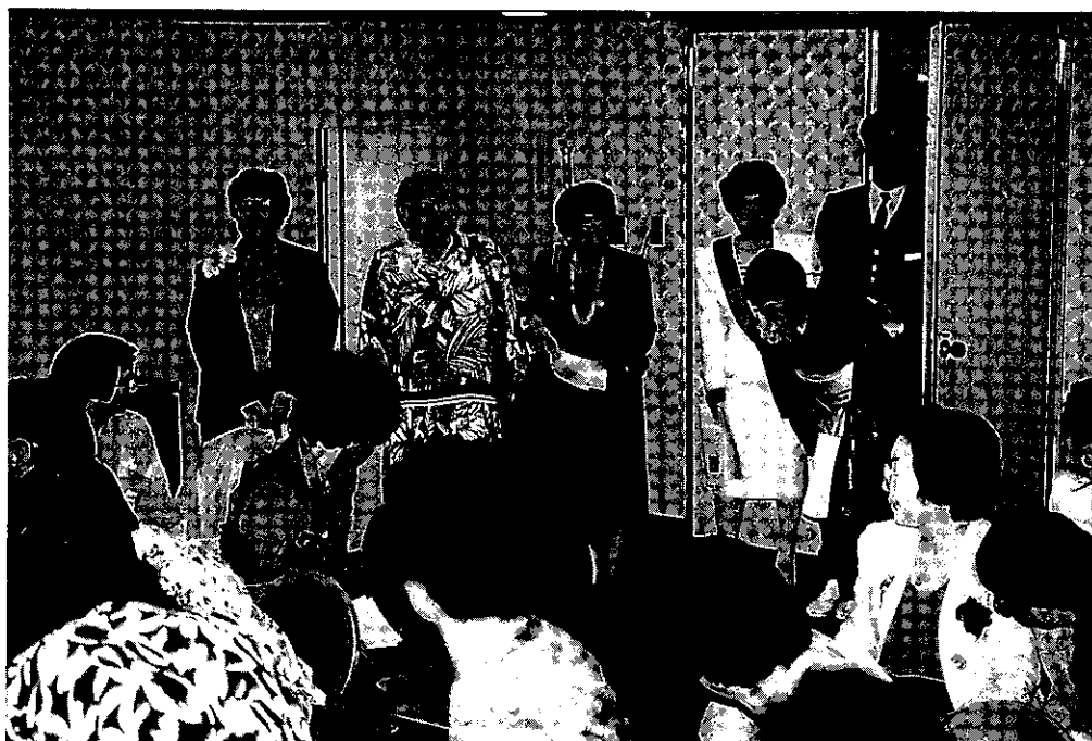
クック連盟会長13分科会を訪問