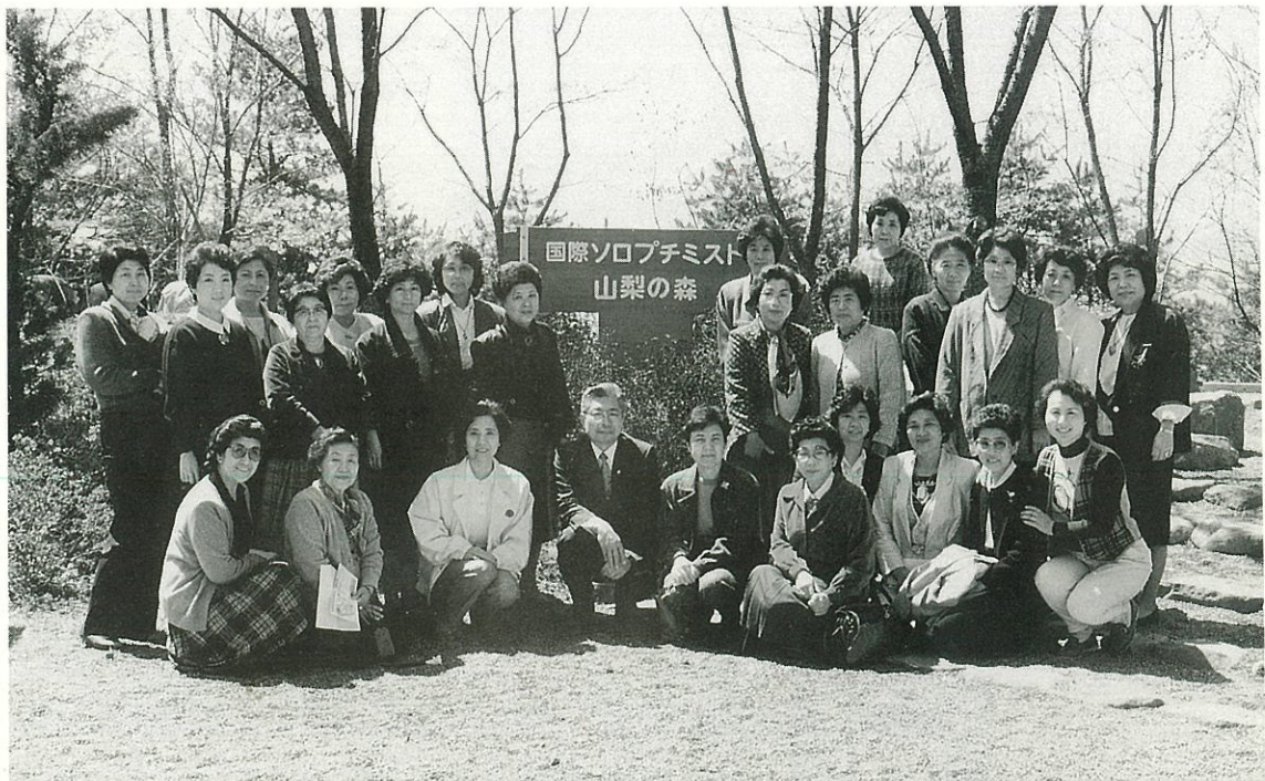
'87.4.13 国際ソロプチミスト山梨の森完成式