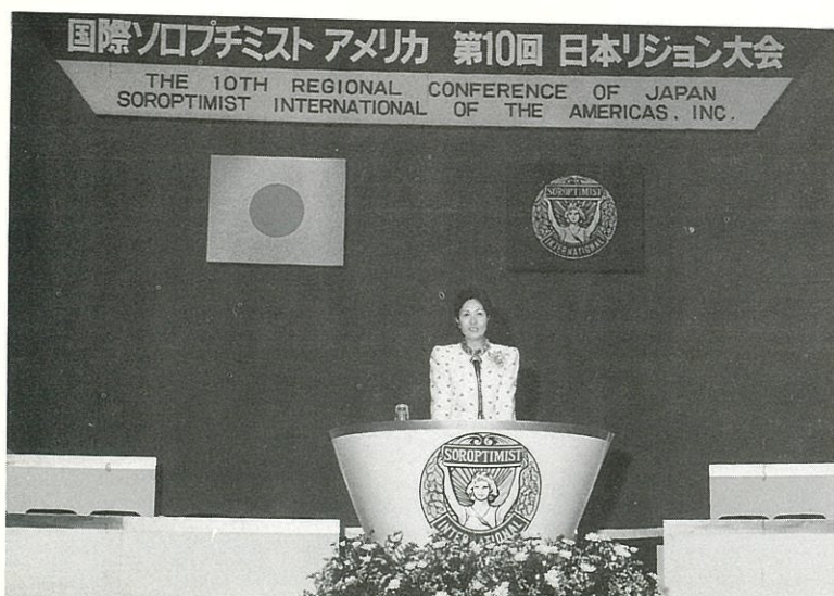
第10回日本リジョン大会基調講演 曾根綾子氏