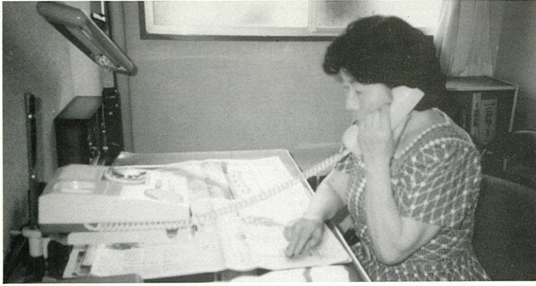
視覚障害者リーディングサービス (月1回)