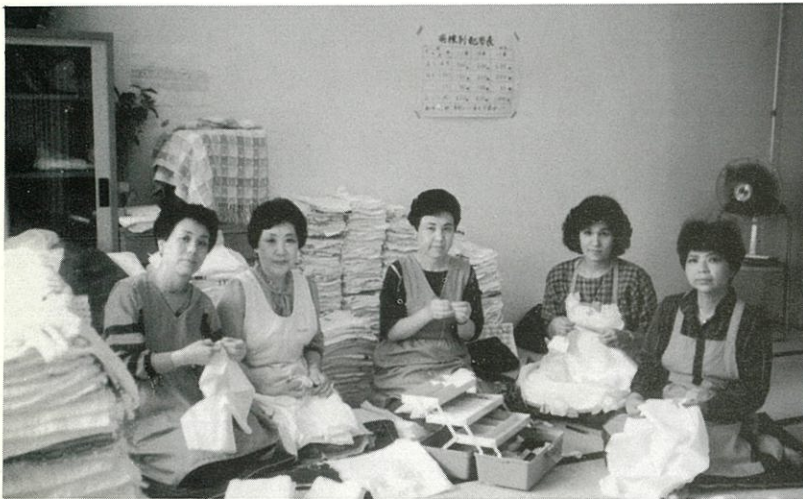
おむつたたみ奉仕 (月1回)