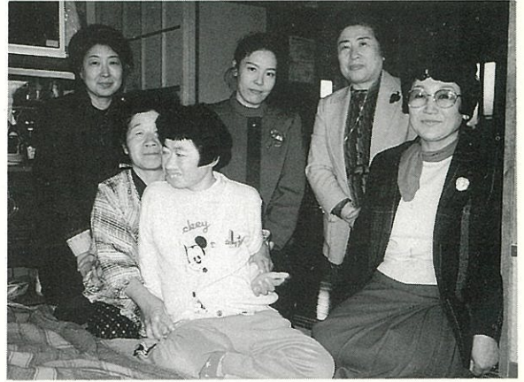
'86.11.20 在宅心身障害者訪問(長坂町) 戸泉会長様と