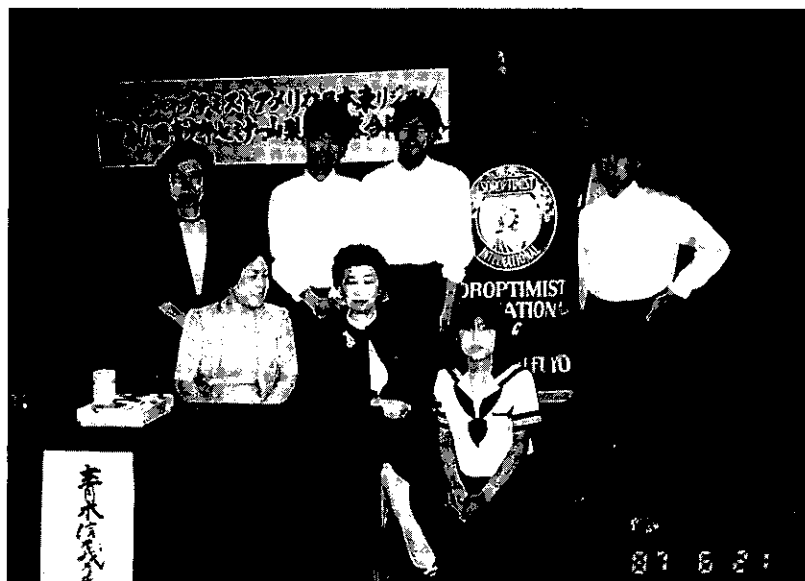
'87.6.21 SI.山梨とSI.山梨美容合同青少年セミナー