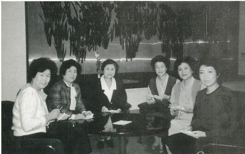
'86.10.20 ファンダーガバナーを偲んで 第126回例会