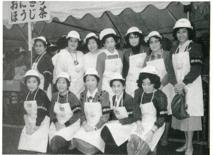
'86.10.26 ふれあいかいじ国体後夜祭