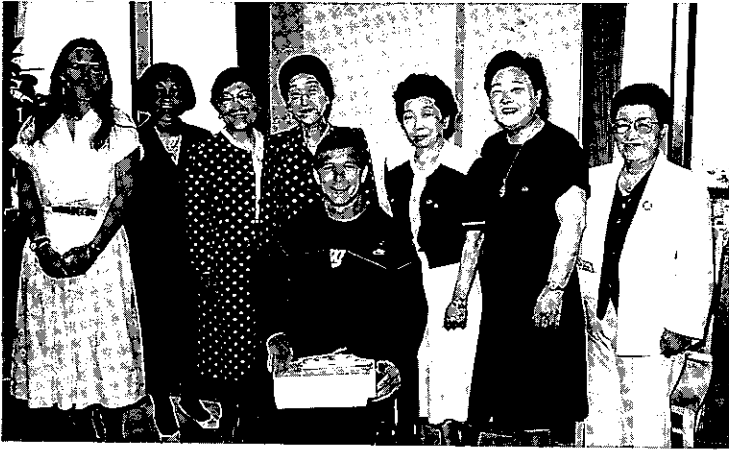
'86.6.14 リックハンセン氏車椅子世界一周 (全日空ホテル)