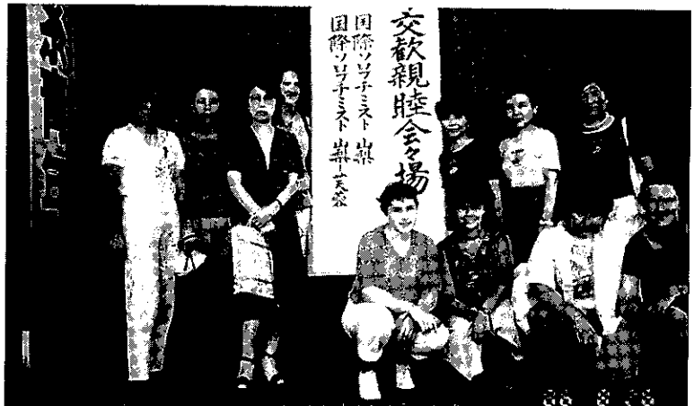
'86.8.26 富士吉田火祭り 研修生・留学生招待