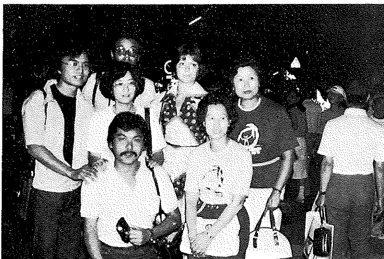
富士吉田火祭 (留学生招待)